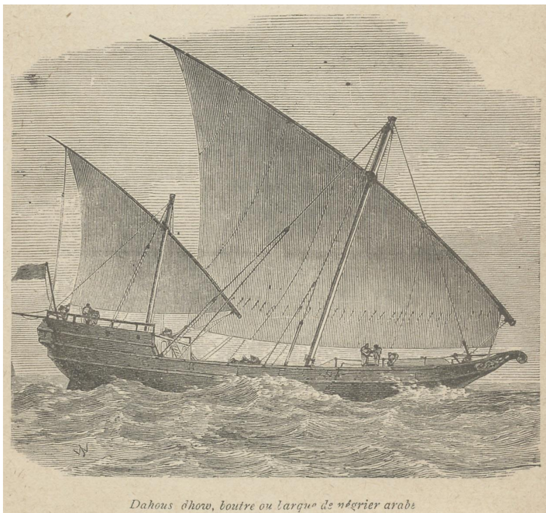
Dahous dhow, boutine ou larque de négrier arabe