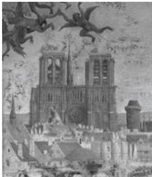
La cathédrale de Paris par Jean Fouquet, Heures d'Etienne Chevalier, vers 1452-1460

A l'église Saint-Marcel (boulevard de l'hôpital ?), il sera chanoine ; il y avait un bénéfice ecclésiastique, une prébende.