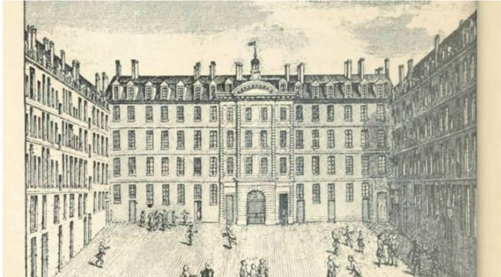
Le Collège d'Harcourt