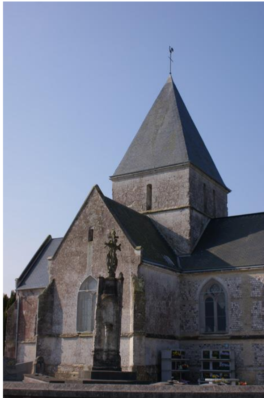
L'église actuelle de Toussaint avec son calvaire