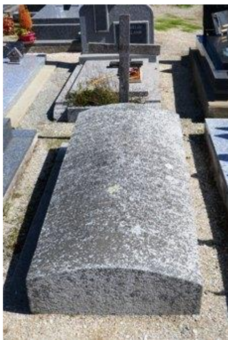
Sa tombe au cimetière de Pleurtuit