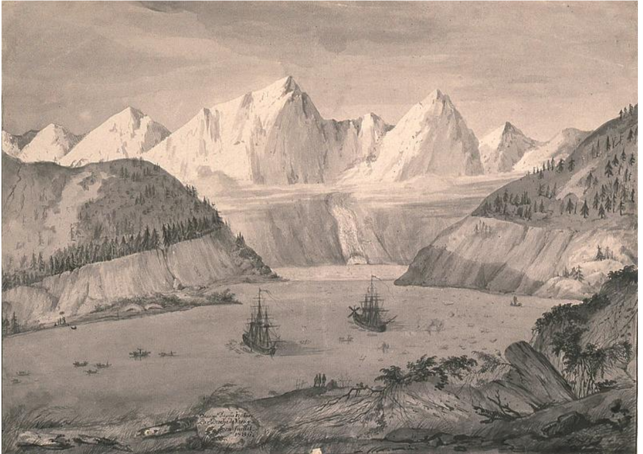
Les deux frégates au mouillage en juillet 1786 à Port des Français, aujourd'hui Lituya Bay, par Duché de Vancy