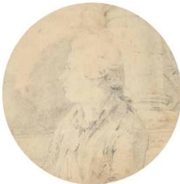
Portrait d'homme - crayon noir - 1783 - Collection Ulmann vendue à Drouot le 11 février 2022